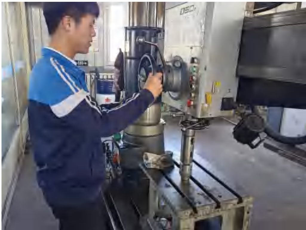
图 5-5 学生协助操作电火花线切割机床