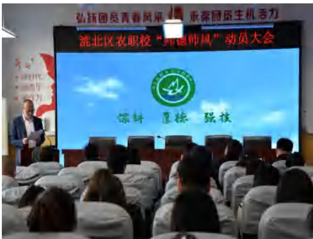
图 2-3 深入贯彻中央八项规定精神学习教育——加强师德师风建设会议