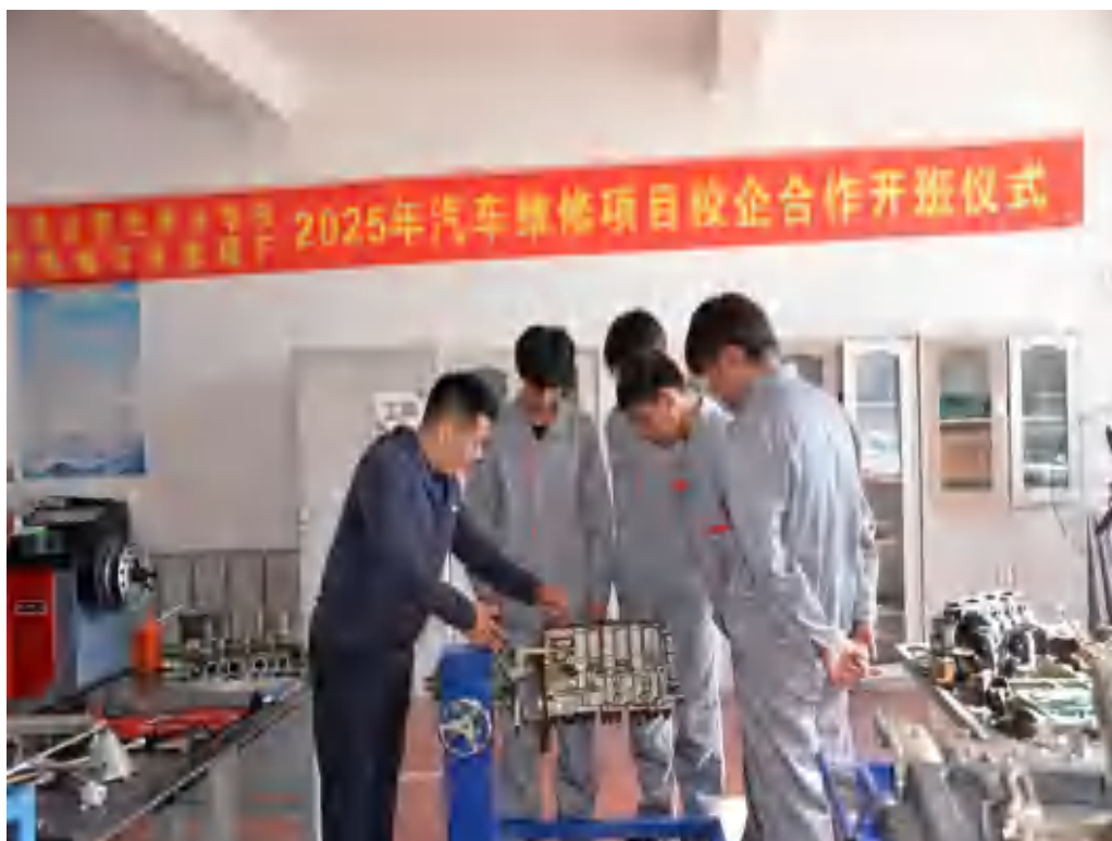
图 5-1 企业技师进校园