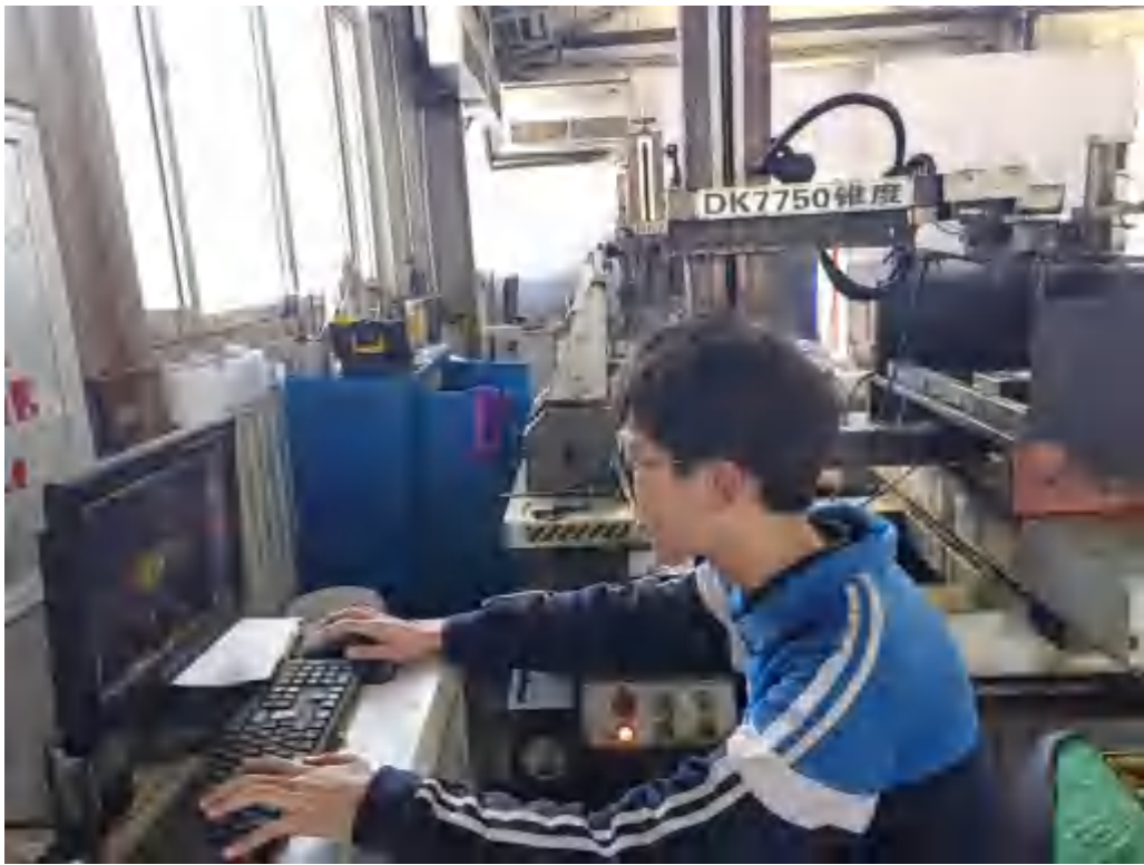
图 5-6 学生协助操作电火花线切割机床