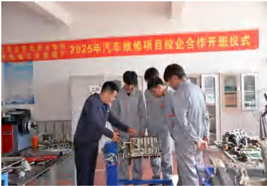
图 5-10 汽车维修项目校企合作开班仪式