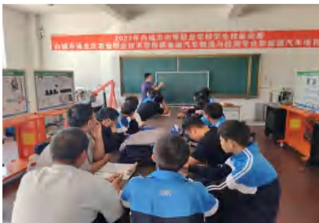
图 5-2 企业技师给学生讲解