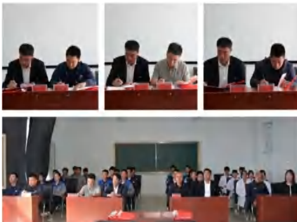
图 5-9 校企合作签约

为更大力度促进学校教师、学生、工厂工人之间的互动与交流，使职业教育体系中的产教融合、校企合作工作呈现出稳中有升、协调并进的良好态势，洮北区农业职业技术学校加大校企合作、产教融合工作力度。