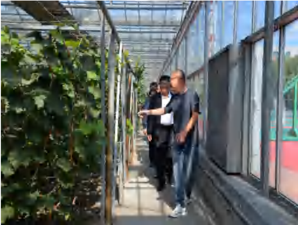
图 3-1 大棚实用技术指导

农村实用技术帮扶、以贫困村种养殖业大户带头人等为重点培育对象，加快培养新型农民队伍，提高贫困村农民整体技能素质。共培训数 500 人。