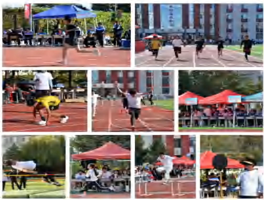
图 4-3 2025 年秋季田径运动会

能素质，培养长期锻炼的健康习惯。锤炼学生的意志品质，在竞技中直面输赢，如长跑项目考验耐力、接力赛需要坚持，帮助学生学会克服困难、正视挑战，塑造坚韧品格。凝聚集体力量，以班级为单位组队参赛、统一助威，从赛前训练到现场协作，强化学生的集体荣誉感与团队协作意识。使学生传递体育精神，通过“友谊第一、比赛第二”的倡导，以及公平竞技、文明观赛的要求，让学生理解尊重、规则与拼搏的体育内涵。