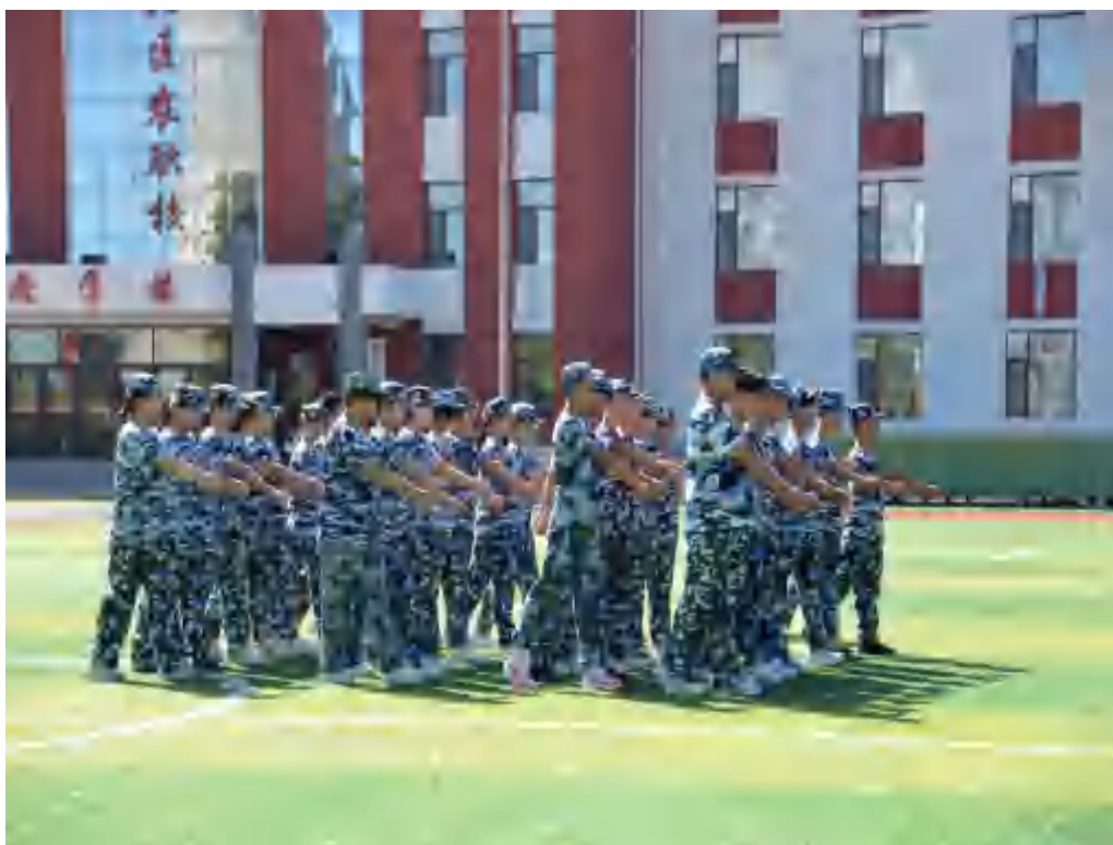
图 4-1 2025 年新生军训