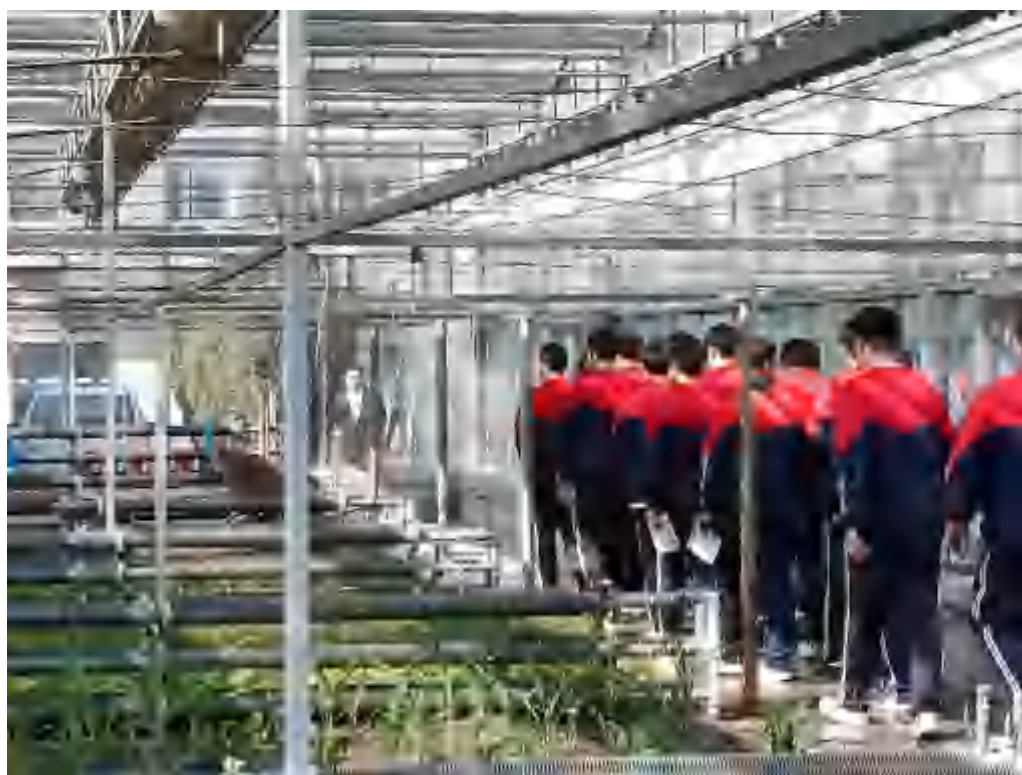
图 2-9 职业体验学生参观大棚

生参与。活动以实训参观和足球赛为核心内容，旨在拓宽学生职业视野，增强实践操作能力，培养团队精神和竞技能力。在解说员的带领下，参与师生分组参观了机加、钳工、汽修、3D 打印、电子电路、烘焙、幼保七个实训室，亲身感受职业技能的魅力；同时，通过参与足球赛等体育活动，进一步提升了团队协作能力和竞争意识。此次活动不仅丰富了在校学生的校园体验，也为周边学校学生搭建了了解职业教育、规划未来发展的桥梁。