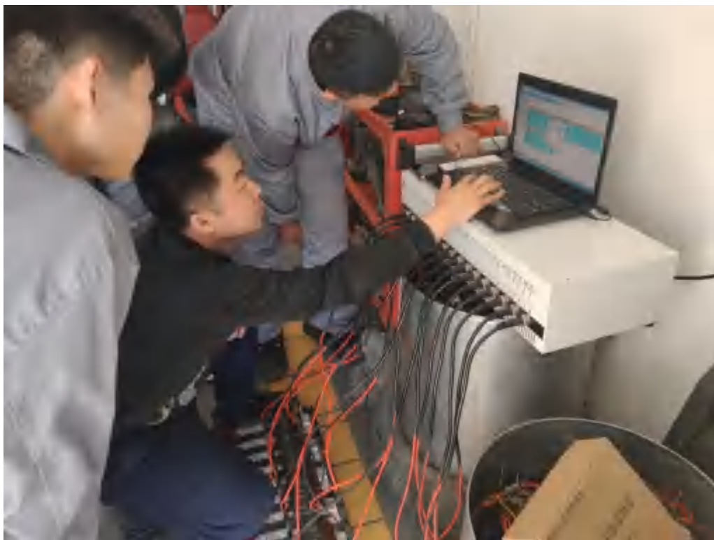
图 5-3 汽修实训