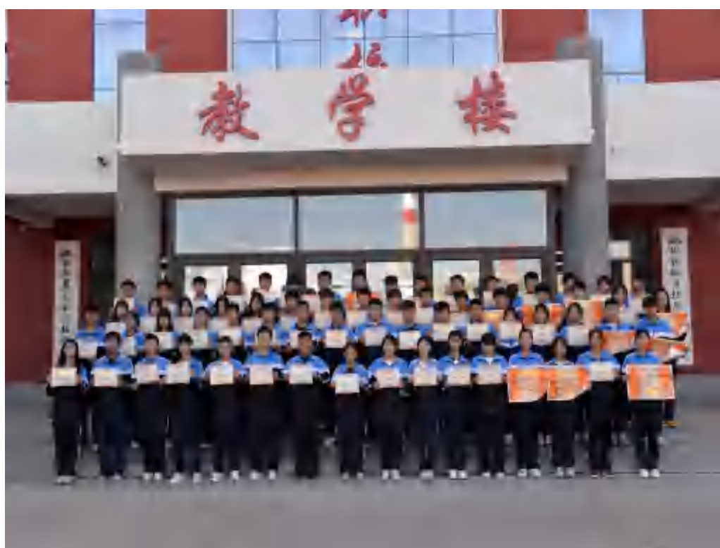
图 2-4 表彰优秀学生

将本学年思想教育主题聚焦于学生日常行为习惯培养。每学期开学之际，通过多种举措开展思想道德教育，从思想层面引导学生树立正确目标，鼓励人人争做先进学生。针对违规违纪学生，实施跟踪教育管理，通过谈心交流等深入细致的工作，做好思想转化，帮助他们遵纪守法、健康成长。结合学生“三优”评选工作，广泛收集各班优秀学生事迹，树立先进典型，正面激发学生学习动力，促进良好学风形成。2025年度共表彰优秀学生、优秀学生干部、优秀寝室长、三好学生等先进个体 55 名，以榜样力量引领学生全面发展。