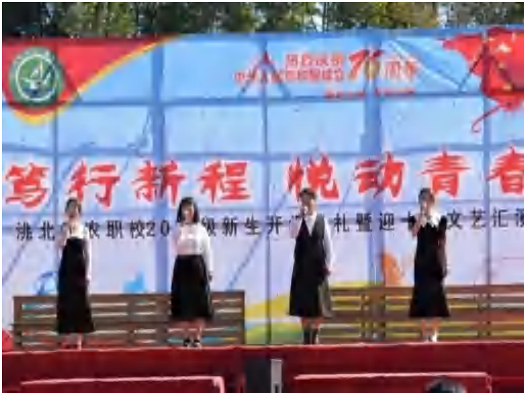
图 3-3 党员教师在文艺汇演上演唱