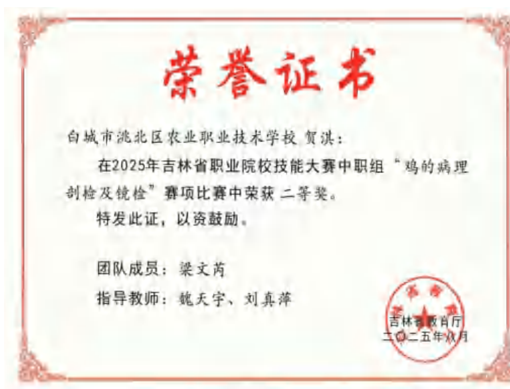
图 2-7 鸡的病理剖检及镜检项目二等奖