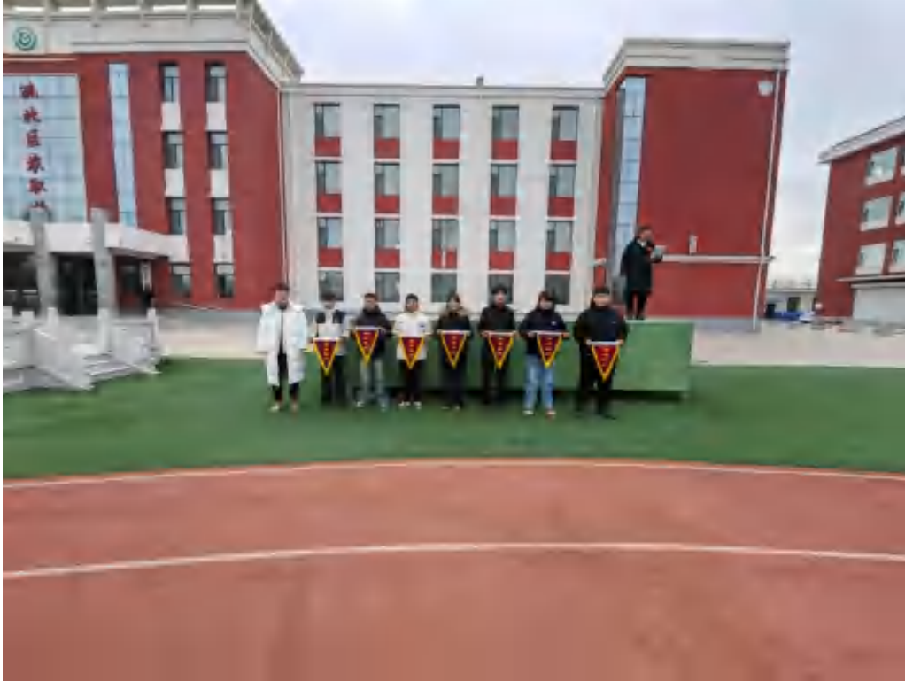
图 2-5 颁发流动红旗

违纪处罚条例》《学生德育成绩考核细则》《流动红旗评比细则》《宿舍管理制度》等一系列配套细则，使学生管理工作有章可循、有规可依。在规范制度的约束下，学生逐步养成良好的生活习惯和行为习惯。