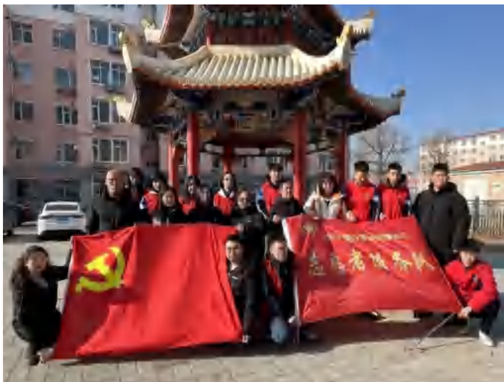
图 3-2 学雷锋志愿服务队为社区居民打扫卫生活动