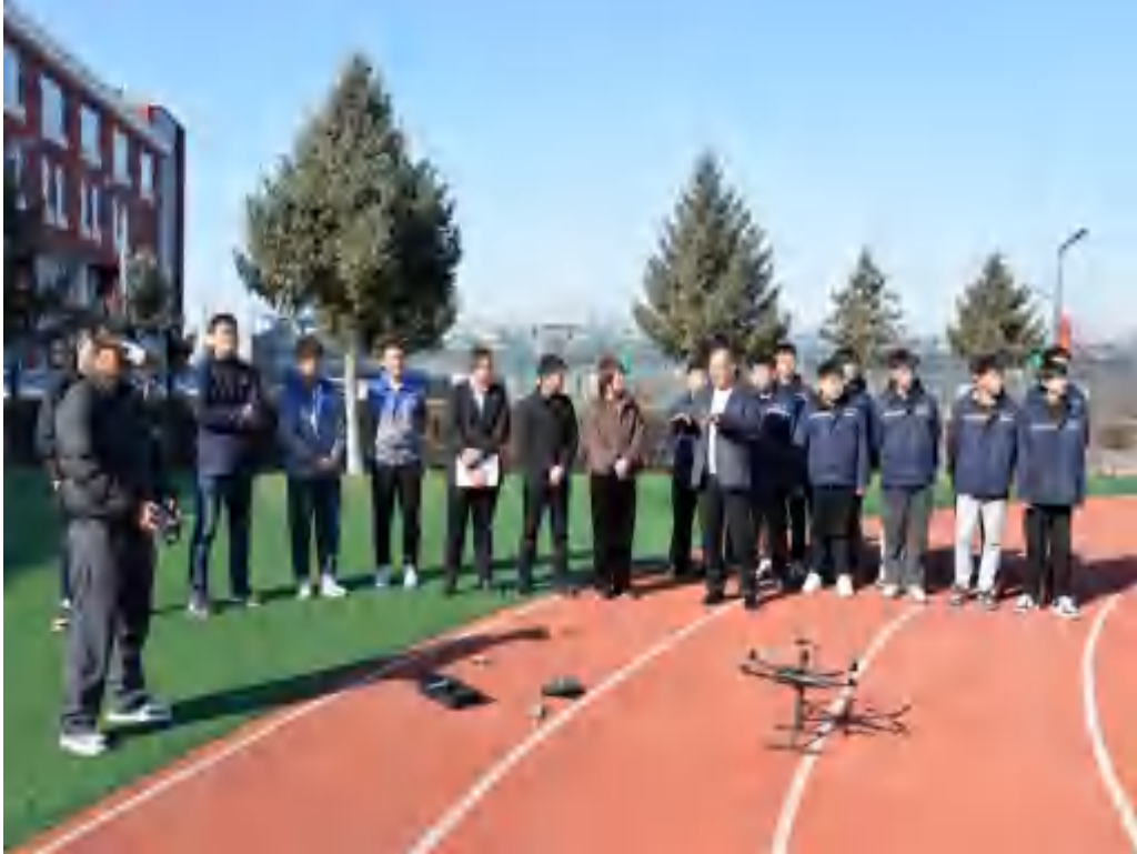
图 1：无人机专业学生在企业导师指导下，开展室外无人机操控技术学习与实际作业模拟。

通过与多家企业共建实习实训平台，实行“校企双导师”制，为学生提供真实生产场景实训；推进“教学—实践—竞赛”融合，将企业项目与技能竞赛融入教学，同时鼓励教师深入企业更新教学内容；聚焦区域需求优化人才培养方案，增设贴合地方产业的课程模块，开展“订单式”培养。