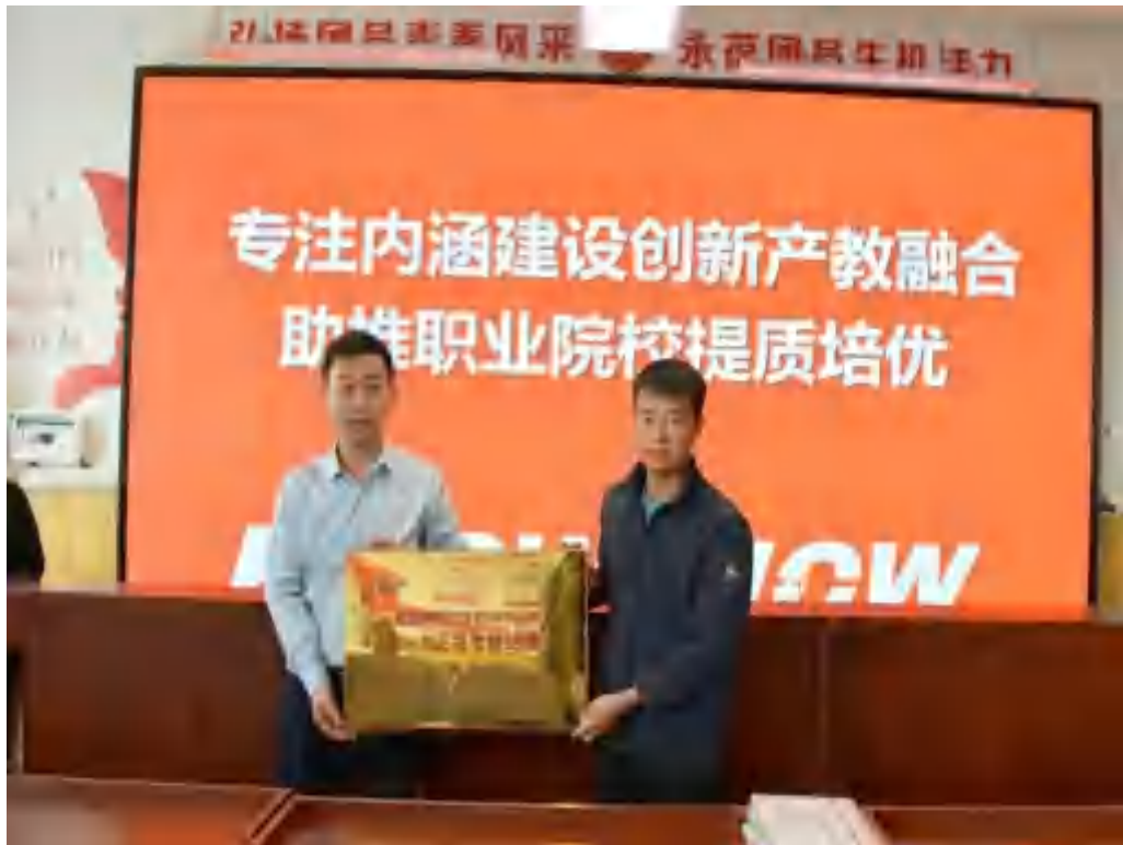
图 5-7 “1+X 证书考核站点”授牌