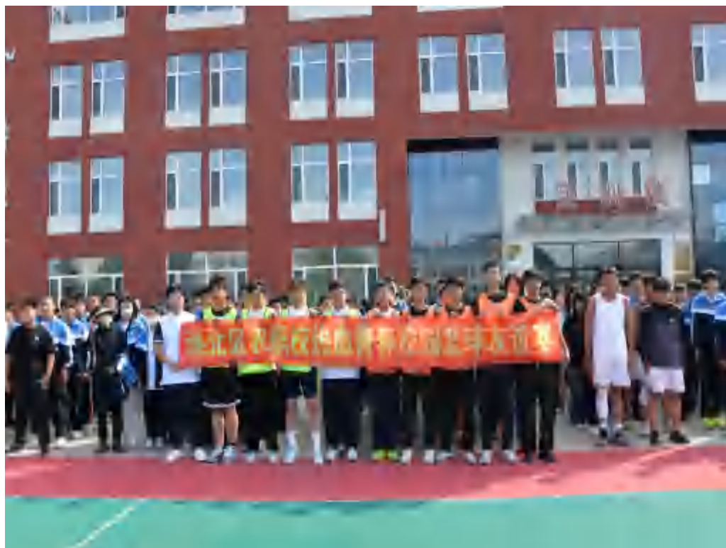
图 4-4 2025 年秋季篮球赛

青春活力，高强度的运动对抗能释放学生学习压力，展现高中生的朝气与活力，同时强化体能，培养运动习惯。增强学生的集体认同感，以班级或年级为单位组队，赛前备战、赛中助威、赛后总结，能凝聚班级向心力，深化集体荣誉感。