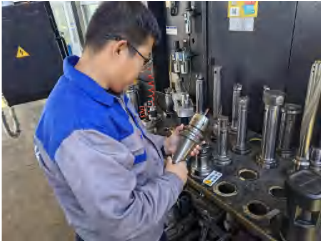
图 5-4 学校教师进入企业进行实践