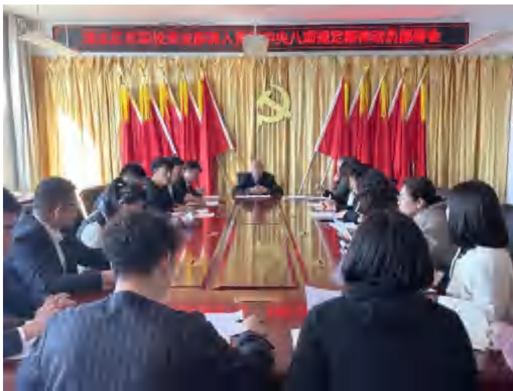
图 2-1 学习教育工作动员部署会

定期组织教师开展政治理论学习，通过集体学习与个人自学相结合、线上学习与线下研讨相补充的方式，依托学习强国、共产党员网等平台拓宽学习渠道，做到学思用贯通、知信行统一。将理论学习成果转化为育人动力，融入课堂教学、德育实践全过程，推动思政教育与学科教学有机融合，引导学生树立正确世界观、人生观、价值观。